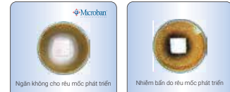
Thử nghiệm chỉ ra hiệu quả chống rêu mốc của công nghệ Microban

Chất bảo vệ Microban® được sử dụng trong quá trình sản xuất, không bị rửa trôi hoặc hao mòn. Chất bảo vệ Micro-ban được ứng dụng nhằm tạo ra tính kháng khuẩn liên tục cho sản phẩm, thậm chí ở những khu vực khó hoặc không thể tiếp cận để làm sạch.