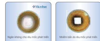
Thử nghiệm chỉ ra hiệu quả chống rêu mốc của công nghệ Microban

Chất bảo vệ Microban® được sử dụng trong quá trình sản xuất, không bị rửa trôi hoặc hao mòn. Chất bảo vệ Microban được ứng dụng nhằm tạo ra tính kháng khuẩn liên tục cho sản phẩm, thậm chí ở những khu vực khó hoặc không thể tiếp cận để làm sạch.