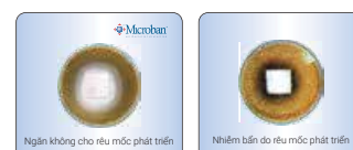
Thử nghiệm chỉ ra hiệu quả chống rêu mốc của công nghệ Microban

Chất bảo vệ Microban® được sử dụng trong quá trình sản xuất, không bị rửa trôi hoặc hao mòn. Chất bảo vệ Microban được ứng dụng nhằm tạo ra tính kháng khuẩn liên tục cho sản phẩm, thậm chí ở những khu vực khó hoặc không thể tiếp cận để làm sạch.